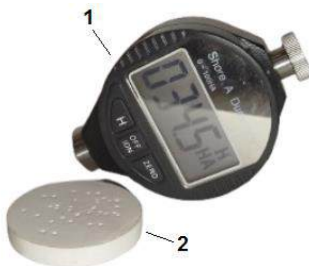
Рис. 1. Прилад і зовнішній вигляд дослідженого зразка: 1 – твердомір Шора моделі 5610 зі шкалою А; 2 – зразок пористого ПТФЕ після вимірювань.

де m – маса пористого матеріалу, кг; V – об'єм пористого матеріалу, м 3 ; \rho_{\text{ПТФЕ}} – щільність ПТФЕ, кг/м 3 .